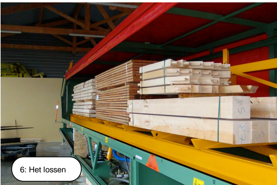
6: Het lossen