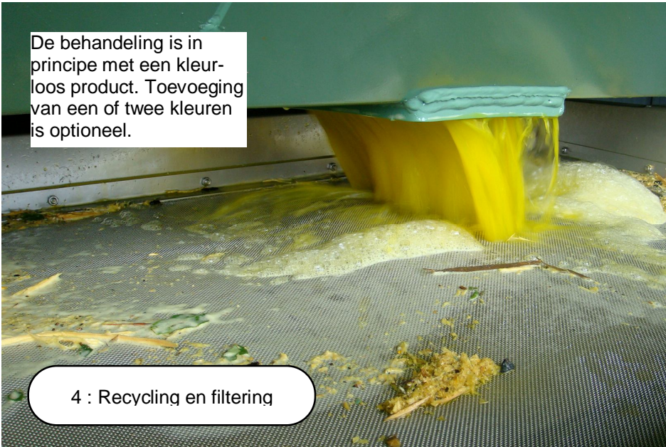
4 : Recycling en filtering

De behandeling is in principe met een kleurloos product. Toevoeging van een of twee kleuren is optioneel.