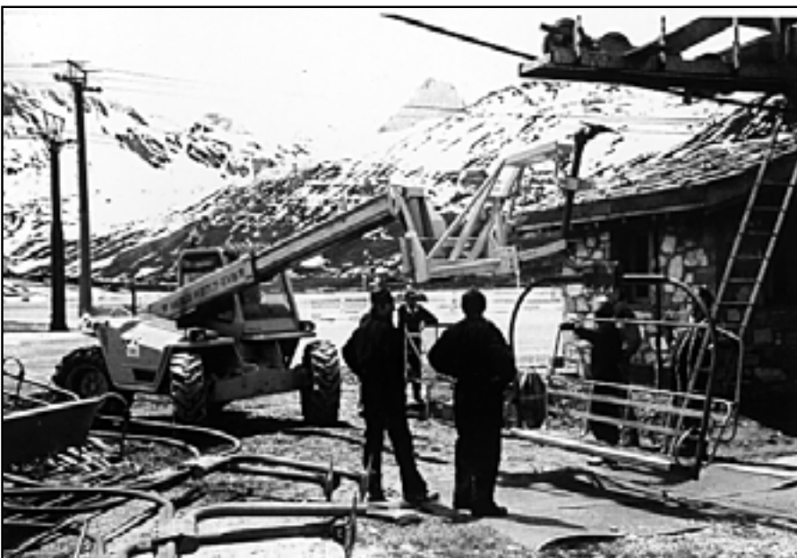
Notre pince a été conçue pour s'adapter aisément au plus grand nombre de sièges possibles avec polyvalence.

CLIENTELE : Stations de ski Société de maintenance de remontées mécaniques. Organismes de contrôle