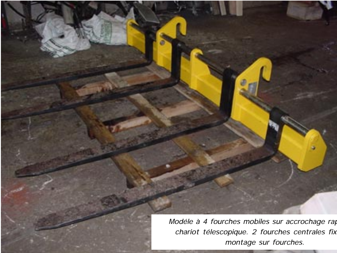
Modèle à 4 fourches mobiles sur accrochage rapide de chariot télescopique. 2 fourches centrales fixes si montage sur fourches.

UTILISATION & POSSIBILITES DU MATERIEL : Manutention de charges longues avec le tablier d'origine. Directement issu de notre ELARGISSEUR fixe, ce matériel possède des fourches extérieures à entraxe réglable manuellement. Il peut s'adapter aux colisages les plus variés.