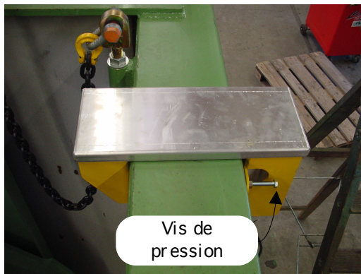
Montage sur la ceinture du bac