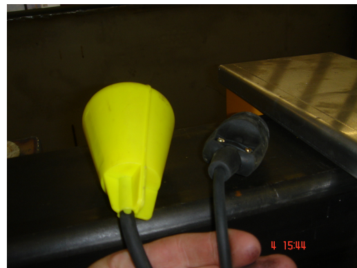
Une simple prise 220 V à brancher