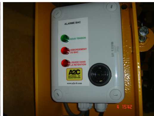
Les défauts éventuels sont affichés en clair. Une alarme sonore avertit du problème.

Ce système permet d'améliorer rapidement et efficacement la sécurité d'une installation existante hors normes.