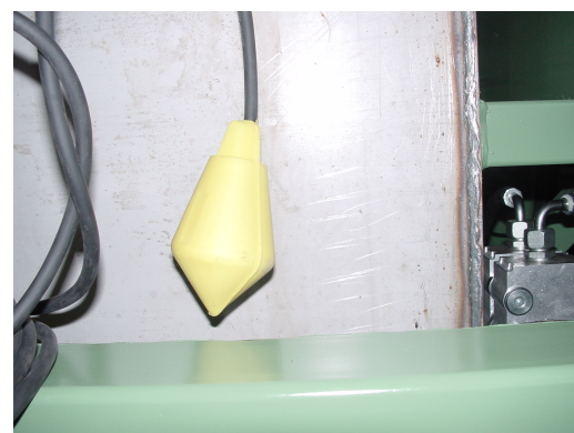
Flotteur de détection de liquide en rétention