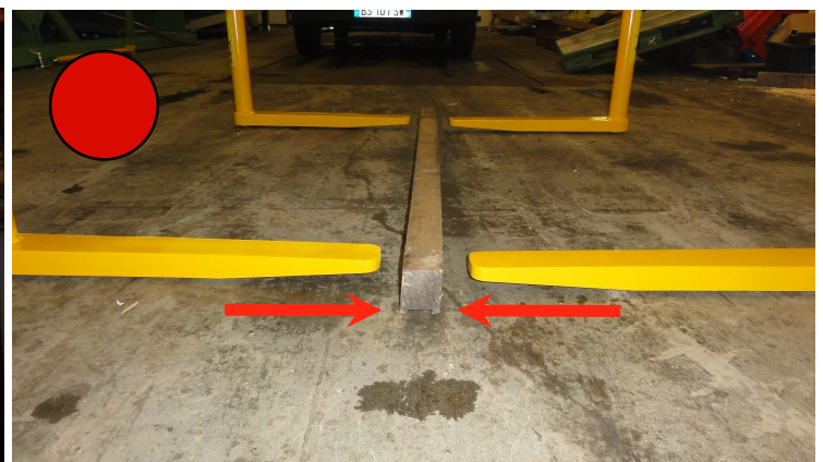
Mogelijkheid om centrale lat onder lading te plaatsen

Werking - Werkt zonder stroom - De vier regelbare dragers onder de lading bewegen simultaan (bij opening en sluiting) - Maar 1 bediening voor alle 4 dragers - wee diagonaal geplaatste bedieningshendels (er is er dus altijd één in buurt van de bediener) - De ladingen moet vlak zijn en losstaan van de grond via latten aan de onderkant - Mogelijkheid om centrale lat onder lading te plaatsen - Onderhoud: 4 smeerinrichtingen