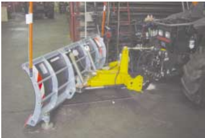
Montage sur relevage 3 points avant.