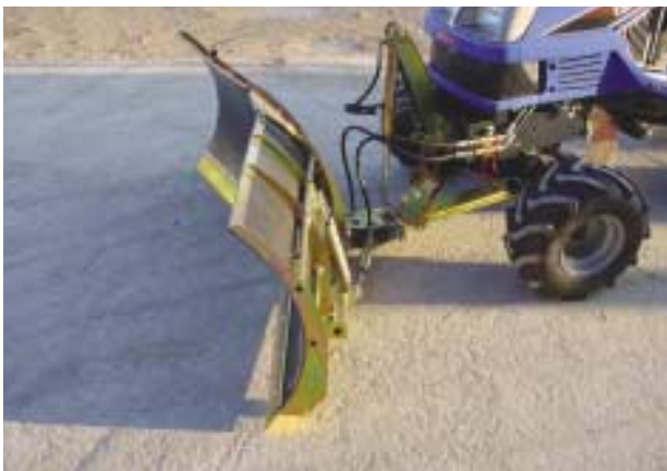
Montage d'une lame VÉ à l'avant d'un micro tracteur avec kit de montage et de relevage spécifique conçu et réalisé par A2C.