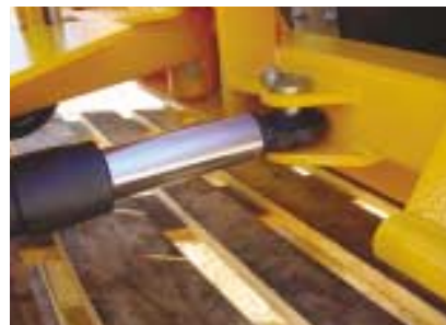
Vérins sur rotules.