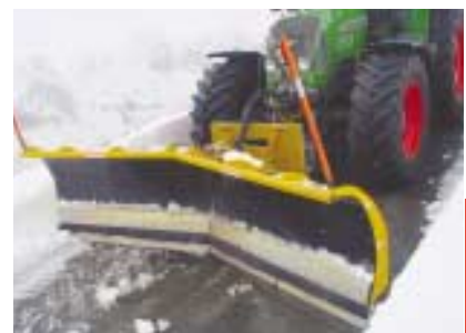
Le choix des pros !