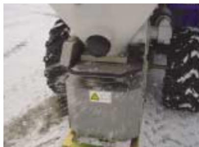
Epandage précis et réglable.