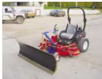
Lame braise sur tondeuse.