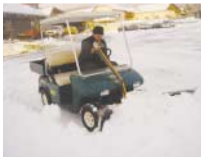
Lame sur voiturette électrique.