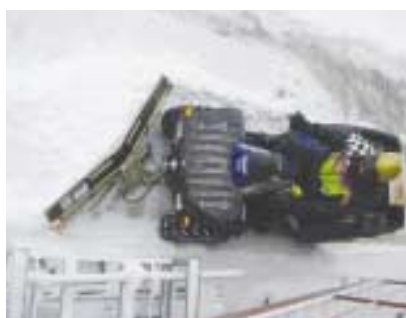
Déneigement professionnel avec une lame VÉ hydraulique sur un quad 4x4.