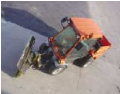
Lame étroite à orientation hydraulique sur engin compact.