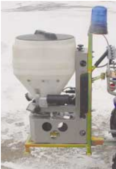
Modèle 70 Litres.