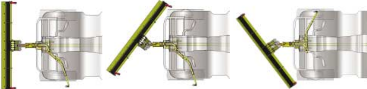
Lame face à la route.

Orientable à gauche et à droite, elle permet d'ouvrir le passage en évacuant la neige d'un côté ou de l'autre. Si l'on pousse la neige droit devant soi pour l'évacuer - à partir d'un certain volume - la neige reflue de chaque côté de la lame, créant 2 bourrelets de neige qu'il faudra "reprendre" au passage suivant. La largeur effective de travail de la lame est ainsi réduite. Convient très bien pour un usage peu intensif ou pour des engins à la motricité réduite (4 x 2 ou pneus très larges réduisant la pression au sol). Ces lames sont équipées de toutes les sécurités et peuvent recevoir toutes les options indispensables.