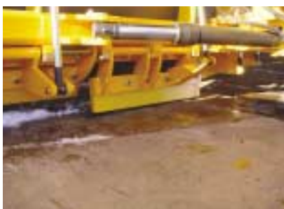
Escamotage de l'HARDOX en cas de choc.