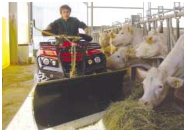
Alimentation du bétail avec une lame braise.