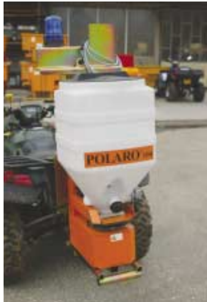
Modèle 105 Litres.