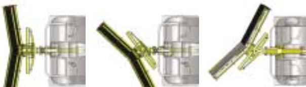
Lame face à la route.