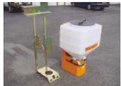
Modèle 170 litres et son support.