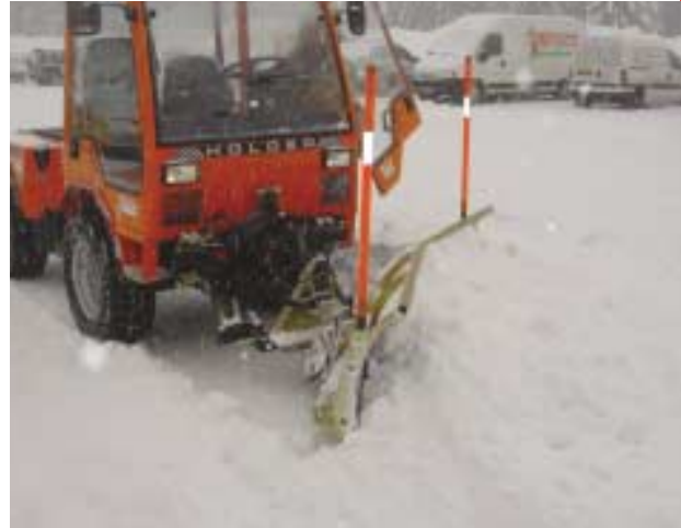
Lame VÉ sur relevage 3 points avant.