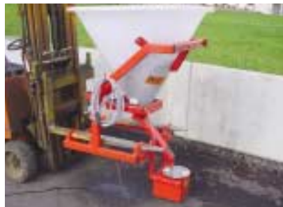
Modèle 250 litres.