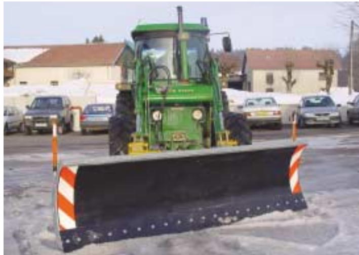
Montage sur chargeur frontal.

Les sécurités intégrées à la lame protègent le chargeur des chocs.