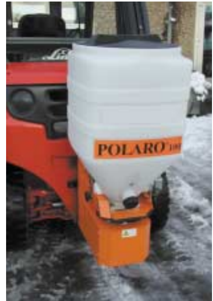
Derrière chariot élévateur.