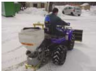
Lame + saleuse 70 litres.