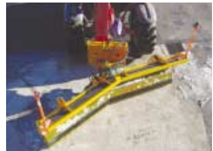
Evacuation à gauche.