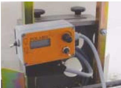
Contrôle électrique complet.