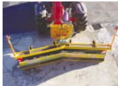
Poussée de face.