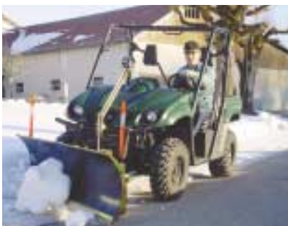
Lame braise sur UTV.