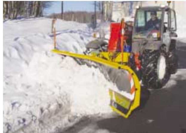
Pour pousser droit devant ET pour déblayer sur le côté.