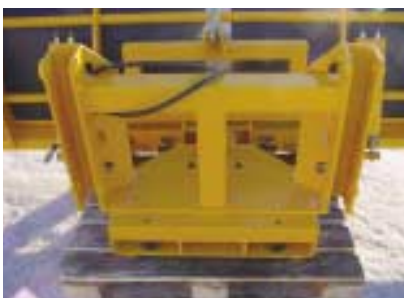
Adaptation sur embase.