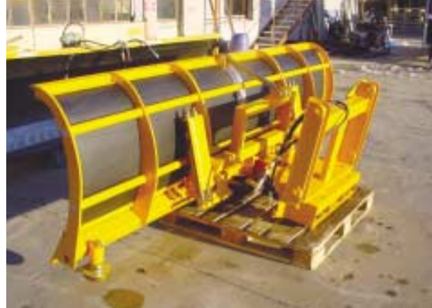
Escamotage par faux châssis.