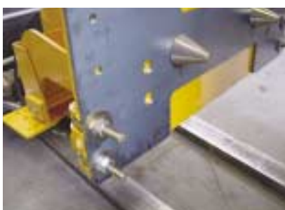
Cônes de centrage et tirants pour fixation du relevage sur la plaque.

Et vous, êtes vous prêts pour la prochaine neige ?