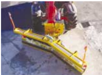
Evacuation à droite.