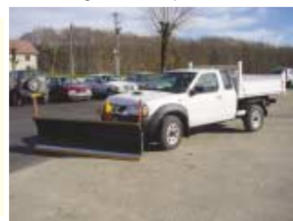
Montage sur 4X4 : nous consulter.

Vous disposez ainsi d'une technologie éprouvée et performante.