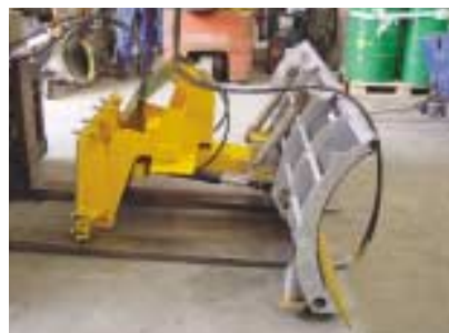
Relevage à parallélogramme pour montage sur plaque SETRA à l'avant.

"Il vaut mieux une lame et pas de neige que de la neige et ...pas de lame" (vieux proverbe montagnard).