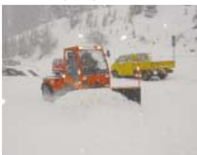
Lame mini VÉ en action.

Des tests en conditions réelles nos locaux étant situés à 1 000 m d'altitude, nous pouvons réaliser de nombreux tests pour la mise au point et l'amélioration des lames A2C.