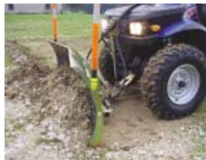
Raclage et remblaiement léger avec une lame en VÉ ne s'enterrant pas de part sa forme triangulaire.