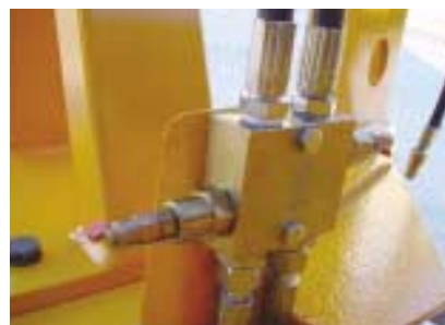
Sécurité hydraulique double.

Un outil solide et efficace pour les porteurs lourds et puissants !