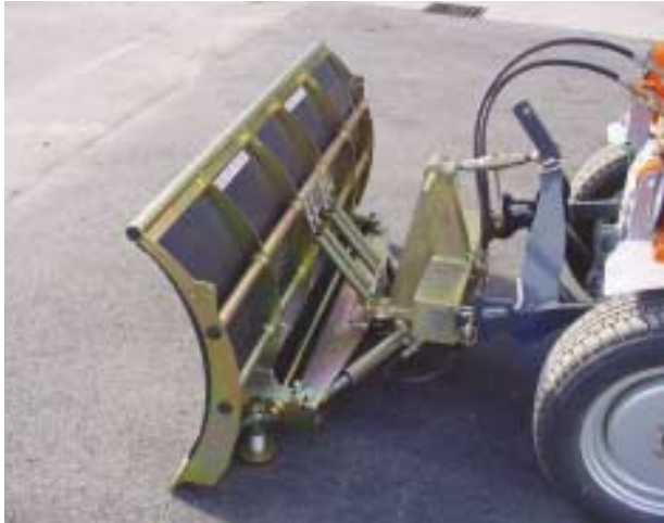
Lame braise sur relevage 3 points avant.