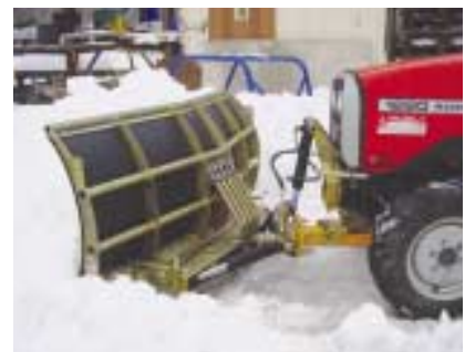
Relevage fixé sur porte masse.