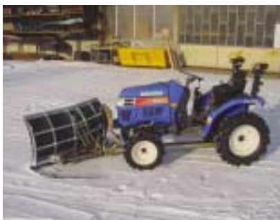
Solide, pratique et efficace.