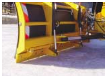
Racleurs escamotables en 4 secteurs indépendants.